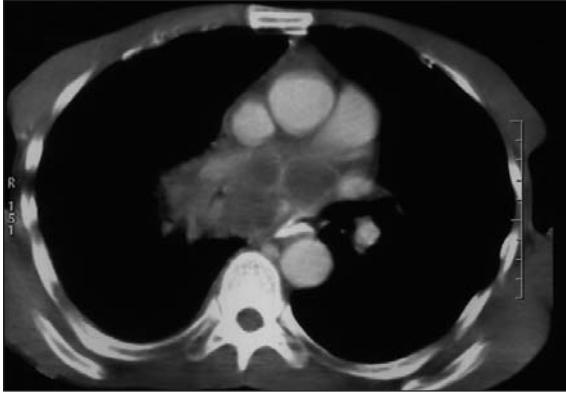
Resim 1. Kontrastlı torakal BT kesitinde sağ hiler bölgeden karınaya uzanan 9 x 8 cm boyutunda, düzensiz spiküle konturlu, heterojen hipodens, heterojen kontrastlanan kitle lezyonu.