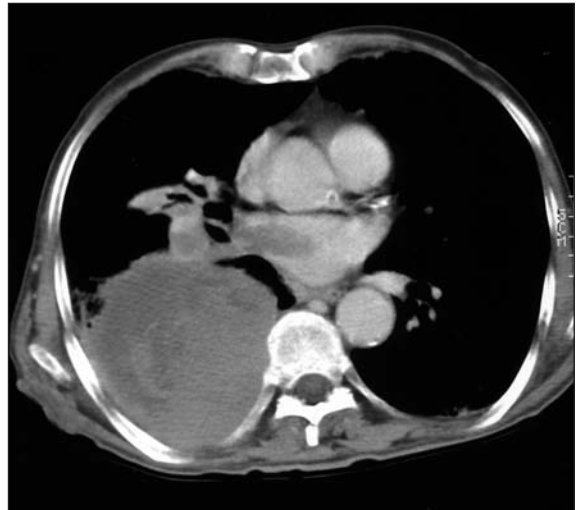
Resim 4. Sağ pulmoner ven içerisinde hipodens nodüler tümöral trombüs.

çapında hipoekoik lezyon saptanan olgunun anjiyografik değerlendirmesinde sağ atriyum içerisine epidermoid kanser metastazı kanısına varıldı. Hastanın genel durumunun girişime imkan vermemesi nedeniyle biyopsi yapılamadı.